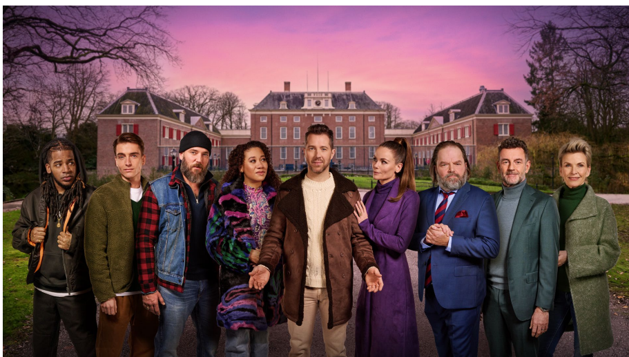
De Cast van de Passion (KRO-NCRV).

De afgelopen jaren werd de Passion ver weg georganiseerd. Dit jaar is de Passion op Witte Donderdag 28 maart in Zeist. Dit is een stuk dichterbij! Vanuit het jeugdwerk lijkt het ons dan ook gezellig, mooi en bijzonder om met een groep tieners de Passion te bezoeken! We gaan graag met de tieners in de OJ-leeftijd, 12 – 16 jaar. Fijn zou zijn als er ook een aantal ouders meegaan om te helpen bij de begeleiding. Waarschijnlijk ontmoeten we elkaar aan het einde van de middag, omdat we op tijd in Zeist moeten zijn. Het is een avondvullend programma, zeker met de terugreis erbij. Al met al zal het een hele belevenis zijn. Specifiekere (reis)informatie volgt snel, maar ben jij nu al enthousiast? Als tiener? Of als ouder-begeleider? Meld je, vóór 25 maart, aan bij jeugdpastor Peter: jeugdpastor@pghaarlem.nl .